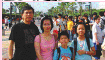
老夫老妻-結婚二十年後與兩子女攝於迪士尼樂園