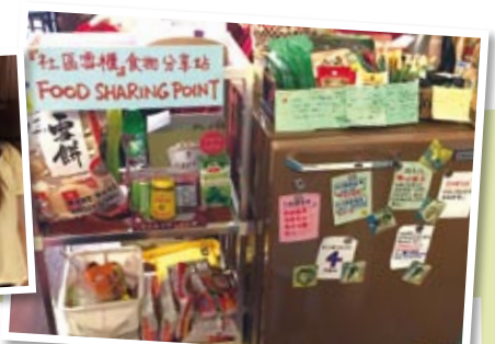
社區雪櫃 Food Sharing Hong Kong

90後的李幸璇('07)在德國電台當實習記者，畢業project是回港籌辦「社區雪櫃」這個項目。項目意念是來自她在德國的三年生活，認識了food sharing這個概念，加上住的地方街頭擺放了一個可供人任取任放資源的櫃，自己也有參與其中，便想到如果在香港，類似計劃到底能否成功？