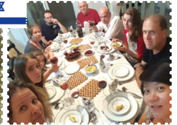
與家人慶祝猶太新年（品嚐蘋果和蜜糖，祝願有甜蜜的一年）