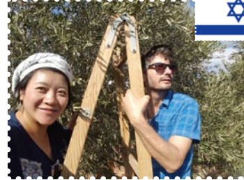
義務參與收割橄欖