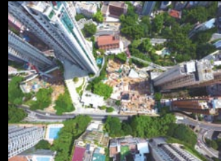
羅便臣道校舍 重建地盤 (Sites A及B)