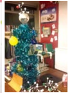
高中化學部為慶祝聖誕而製作的Chemistree