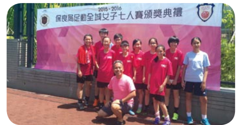
足球隊在第一次公開比賽中取得殿軍