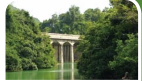
大潭篤水塘2座石橋，很有羅馬水道feel