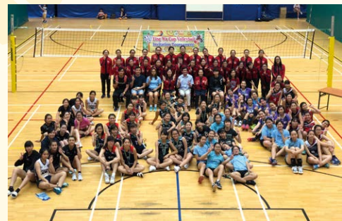
頒獎後全場大合照