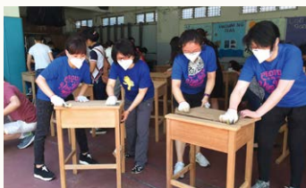
▲ 大家都用力地拿砂紙刷牙刷