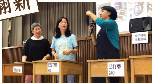
▲ 穿上工作圍裙的黃老師（右一）在解釋翻新桌椅的工序