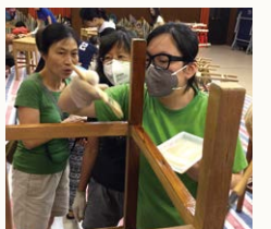
▲ 同學在示範如何掃上油漆

說到母校重建，怎能不提課室裏實木書桌和座椅的去向？數十年來它們靜靜地陪伴了多少代英華兒女成長，見證着課室裏無數美麗的回憶！可惜現在它們已有點殘舊了，為配合新校發展，校方決定把它們翻新，既為環保出一分力，又可以讓一眾校友、家長參與一番。