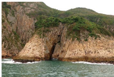
▲ 這座岩石的形狀既像象鼻，亦像茶壺的把手。