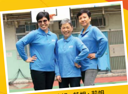
左起：德姐、英姐、莉姐