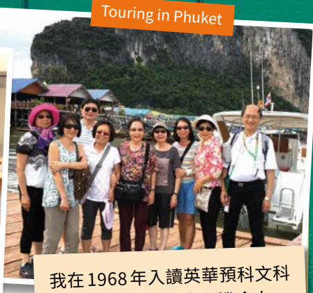
Touring in Phuket

http://www.ywgsaa.org.hk/sites/default/files/newsletter_overseas/OAN_1902.pdf