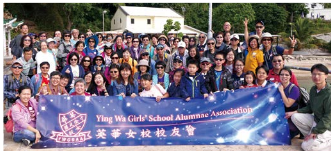
▲ 一眾校友樂而忘返，獲益良多。