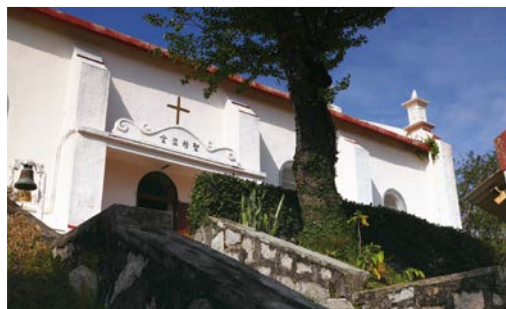
▲ 聖若瑟小堂為香港二級歷史建築，並獲頒 2005 年聯合國教科文組織亞太區文化遺產優異獎。