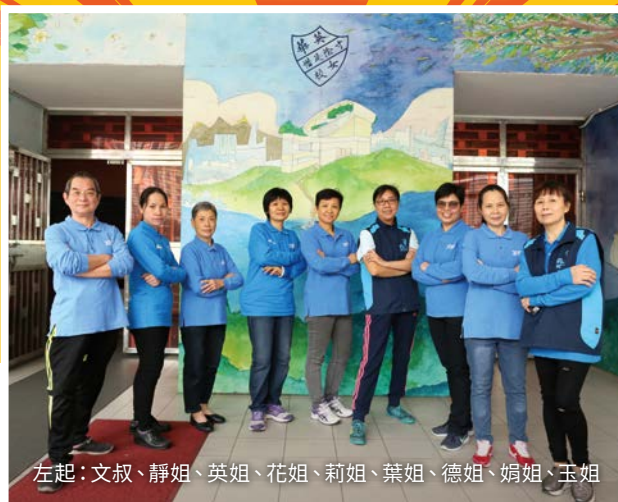
左起：文叔、靜姐、英姐、花姐、莉姐、葉姐、德姐、娟姐、玉姐