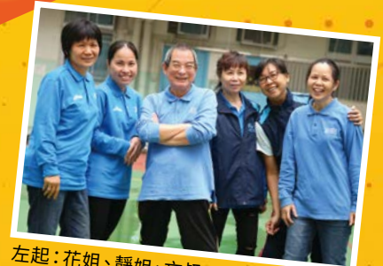
左起：花姐、靜姐、文叔、玉姐、葉姐、娟姐