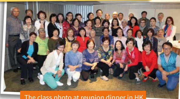
The class photo at reunion dinner in HK

我從沒有參加過一次旅遊，像今次般高興自在的！這是少年十五二十時歲月如歌的緬懷和重溫，真摯的同窗情誼的重現和發現。英華人，永遠能夠「非以役人，乃役於人」，多謝策劃小組；也多謝英華姑爺們的參與，讓英華溫情在五十年後再濃化開，滋潤著大家的黃金歲月。