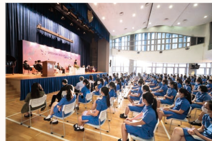
▲ 實施社交距離下的畢業禮

中、英文科口試取消，網上放榜……關校長表示，他體驗到“Prepare for the Worst, Hope for the Best”是最管用的正面態度。疫情催使大家靈活應變，適應各種「新常態」，中六同學以這種心態沉着應戰，因此整體考試成績理想。他特別感恩學校迅速舉辦了畢業禮，更請來專業攝影師為同學拍攝個人畢業照。畢業禮的安排是上帝對英華中六同學的祝福及眷顧。