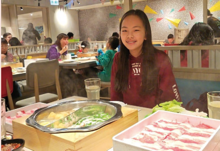
▲ 冼禕藍懷念在疫情之前出外用膳的樂趣