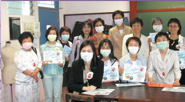
▲ 2003年沙士疫症 - 生果大使

英華女學校校友會(下稱「校友會」)於一個世紀之前(1920年)由樂慕潔校長創立。筆者專訪8位主席,以了解校友會的發展。