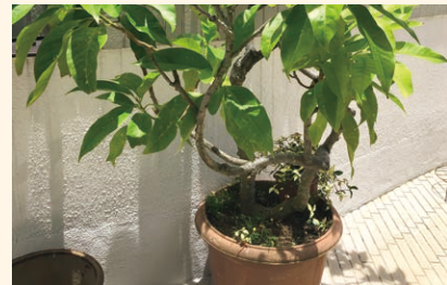
▲ 經歷三校的白蘭樹，見證學校重建