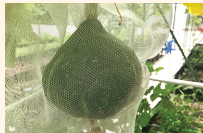
▲ 佔地少產量多的小型品種栗子南瓜