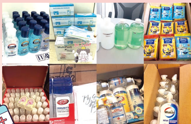
▲ 各方友好捐贈的抗疫物資

疫症雖然可怕，但挑戰往往帶來機遇，亦是守望相助的時候。關校長寄語各同學及剛畢業的英華女兒，在現今世代，我們都活在未知數中，但只要繼續以正面態度為未來作周全而穩妥的準備，時刻抱着信心和希望，必定可迎上每個困難。