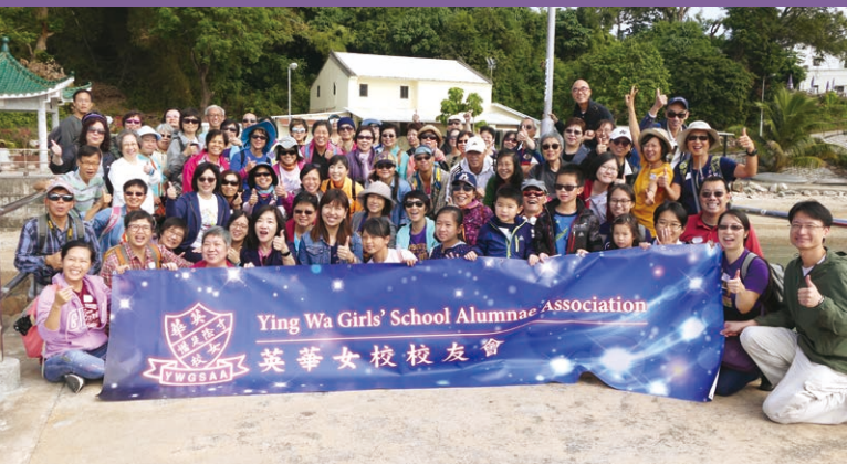
▲ 2018年「西貢地質、鹽田梓生態文化」之旅