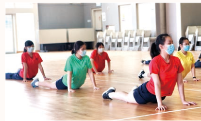
▲ 戴着口罩上體育課

中六同學一個學年內經歷多次停課，沒有了陸運會畢業盃；模擬試中段突然停課；然後中學文憑試 (DSE) 又一再延期，