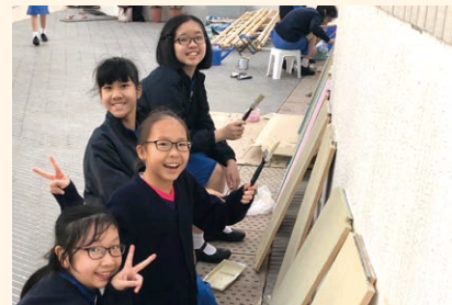
▲ 同學在種植場幫忙做裝置