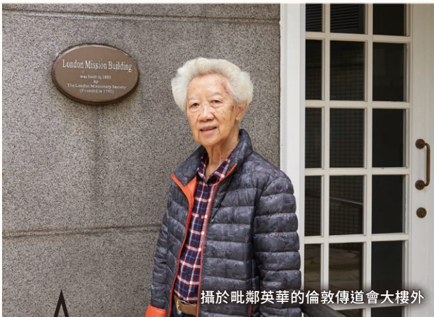
攝於毗鄰英華的倫敦傳道會大樓外

自1946年戰後入讀英華女校初中一，到1977年離職赴英在世界傳道會工作，我曾是英華的學生、老師、校牧、副校長、校董、校監。退休後本已沒有什麼銜頭，除了仍是牧師，忽然驚覺今年榮升「二八佳人」（八十八歲！），也自知「吾老矣」！