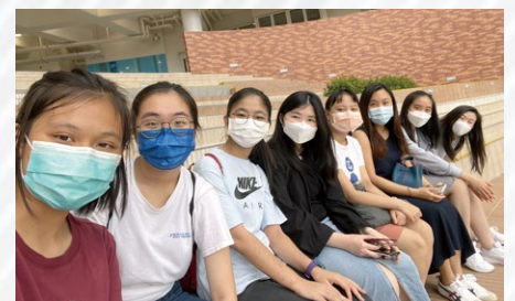
▲ 左起：受訪的五位同學與小編們連成一線

同學們，謝謝你們將近三年來的努力和對學校在抗疫期間應變措施的理解和合作。你們的聲音，我們聽到了。