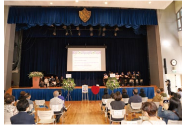
▲ 母親在5月2日逝世，生命讚禮追思會在6月18日舉行。