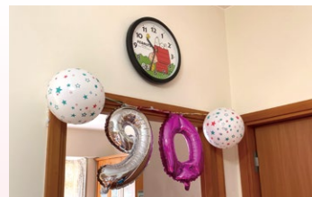
▼ The Caring Team helped decorate her flat for this joyous occasion.

and high-spirited. She talked a lot of her sweet memories, recounted God's grace in her life and showed much concern about what was happening around, especially in Ying Wa. She was particularly impressed and touched by the care and support in the Ying Wa