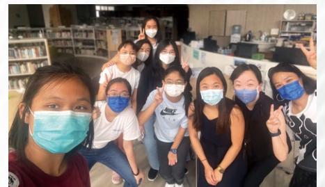
▲ 大家在圖書館合照