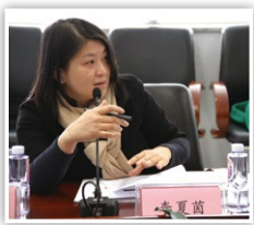
▲ 李醫生出席工作會議