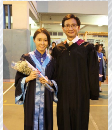
▲ 畢業禮後與關校長的合照