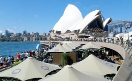
悉尼歌劇院戶外活動