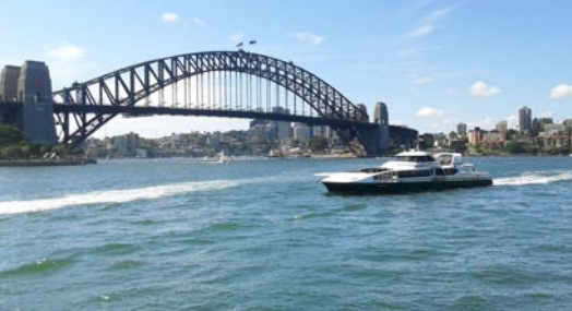
悉尼港灣大橋、渡輪遊