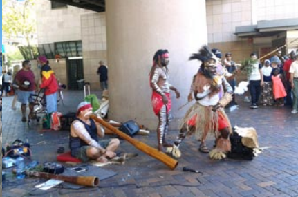
澳洲土著音樂表演

為能與家人重聚，我決定於退休後，離開「生於斯、長於斯」的香港，移民澳洲。在新州生活了一年，我需要從以往急速的步伐，慢慢調適至慢活。每天在家中寬敞的露台上，欣賞在晴朗的天空上建構成不同形態的雲彩，儼如一幅美麗的圖畫！