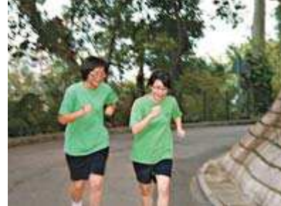
學生與好友一起練跑，互相成爲對方的推動力。

本着長跑背後的理念，三位老師與校方商量後，決定把校慶數字一百一十周年拆解成爲「一」、