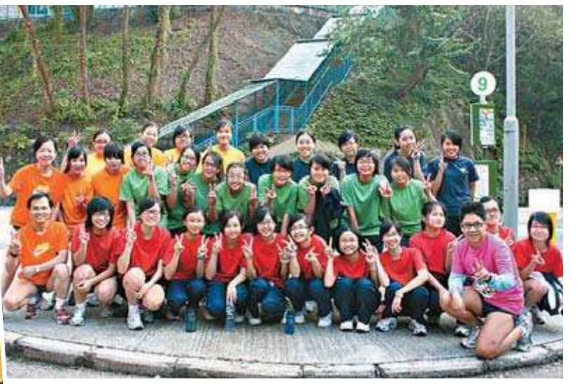
英華女學校爲慶祝一百一十周年校慶，將派出逾百多名師生出戰渣打馬拉松比賽。